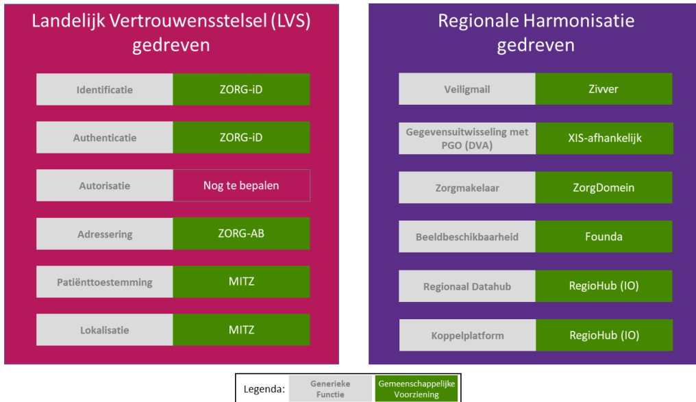
Figuur 1 -Regio NHN Generieke Functies en Gemeenschappelijke Voorzieningen